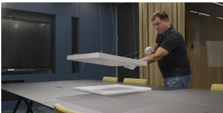
Le microphone de plafond Sennheiser a été livré, installé et mis en place par Supravisio AG

La plus grande salle disponible dans le salon Coworking Tessinerplatz s'appelle Mercato. Elle a été créée pour être un espace polyvalent pouvant être utilisé à diverses fins. Elle offre 53 m 2 de surface au sol et dispose d'équipements de travail numériques de pointe, tels que de grands écrans tactiles avec la fonctionnalité smartboard. La salle de conférence est, bien entendu, équipée d'une technologie de vidéoconférence de haute qualité. Outre une caméra, un écran, un codec et des haut-parleurs à matrice linéaire, l'équipement comprend également le microphone TeamConnect Ceiling 2 de Sennheiser, qui est suspendue au plafond au milieu de la salle. Ce microphone de plafond révolutionnaire, conçu par la marque allemande, a été livré, installé et mis en place par la société suisse Supravisio AG