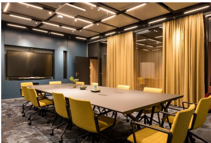
Le microphone de plafond TeamConnect 2 de Sennheiser s'intègre élégamment dans l'aspect moderne de la salle de conférence Mercato

L'hygiène étant devenue une préoccupation majeure de nos jours, TeamConnect Ceiling 2 apporte également une solution très sensée : fixé au plafond, il ne nécessite pas de nettoyage permanent comme le demanderaient des microphones de table. Par ailleurs, le fait qu'il couvre de manière fiable l'ensemble de la salle, sans besoin de réglages préalables, permet aux participants de s'asseoir à la distance désormais recommandée.